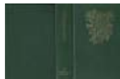
Det fjerde og siste bind av Breviaret behandler Det alminnelige kirkeår.

De tre tidligere bindene av Breviaret (I, II og III) behandler Herrens komme med de store høytidene fra løftet til fullbyrdelsen, fra advent til og med pinse.