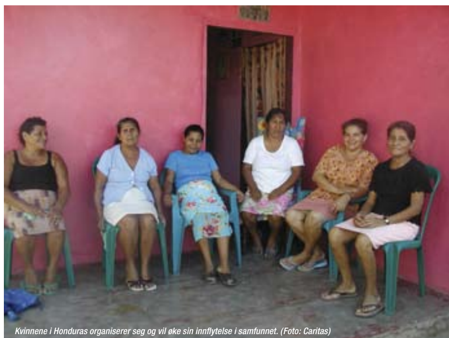
Kvinnene i Honduras organiserer seg og vil øke sin innflytelse i samfunnet.