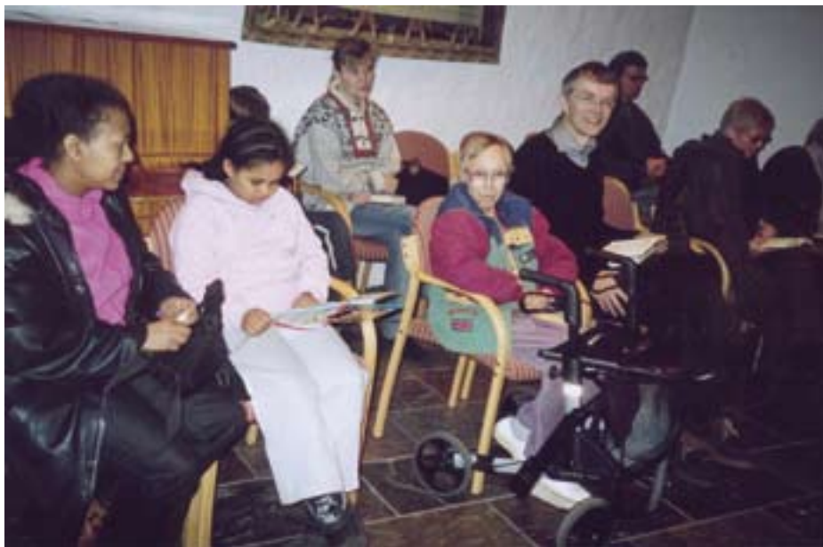
Messefeiring i torgkapellet i Farsund.