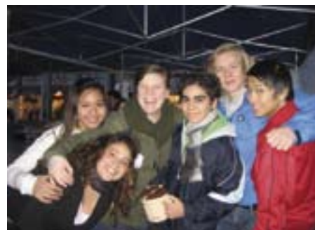
Glimt fra Bergen.

Adventsaksjonen 2006 har nå bevist gitt resultat i klingende mynt. Totalt er det nå kommet inn 346 523,18- til Norges Unge Katolikkers AA-konto eller direkte til Caritas. Resultatet i 2005, tidligere "all time high", var 280.619,50.