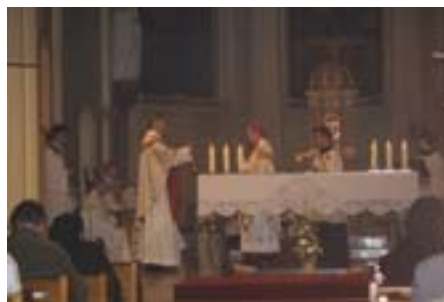
Nuntius presiderte ved Kyndelsmessen i St. Olav domkirke.