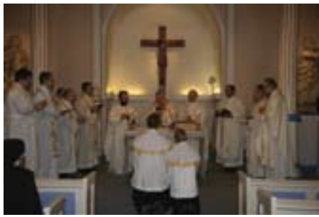
Nuntius feiret messe i Vår Frue kirke, sammen med flere av stiftets prester.

Prosessen med å finne ny biskop til Tromsø er nå kommet i gang. Den apostoliske nuntius til Norge, erkebiskop Giovanni Tonucci, besøkte i den anledning Tromsø fra 16. til 18. januar.