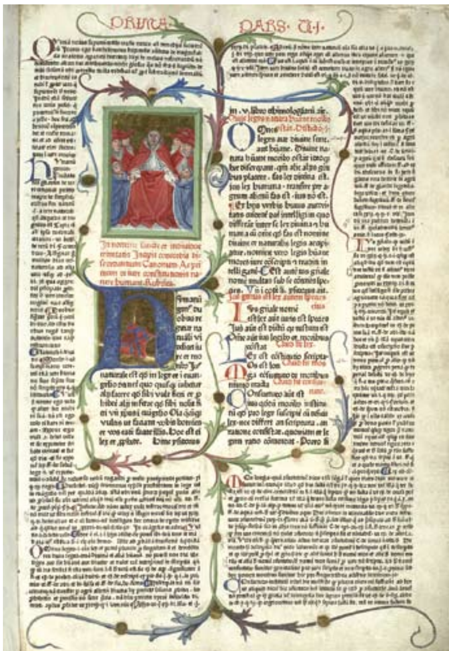
Den mest kjente samlingen av kirkerettslig materiale ble utarbeidet av Gratian, kanonist i Bologna i Italia, som i 1140 publiserte sine dekreter.

lige administrasjon – den romerske kurie – viktig for utarbeidelsen av felles lover for hele Kirken.