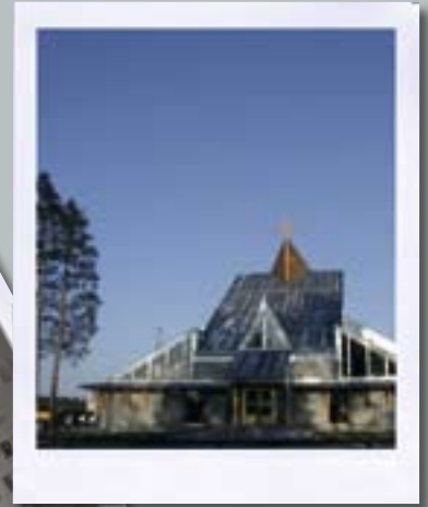
Kirken er bygget etter konstruksjonsprinsipper fra de tradisjonelle norske stavkirker.

Menighetslivet preges av mennesker med forskjellig bakgrunn og kultur. Det utgjør kirkens mangfold. Det er menighetens oppgave å ta vare på og fremme hver enkelts kultur og egenart, slik at det kommer alle til gode