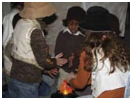
Glimt fra Tromsø.

· Ungdommen i Bergen sto på Torvallmenningen i all slags vær, arrangerte konsert i Krypten og samlet inn 56 283,50, det beste resultatet for en menighet noen gang.