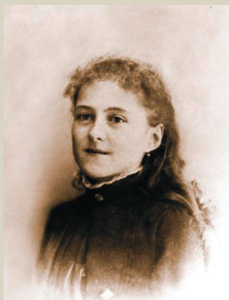
Thérèse i 1886

«Om Thérèse av Lisieux kan man si at Den Hellige Ånd ledet hennes hjerte til å åpenbare klart og tydelig for mennesker av i dag dette grunnleggende mysterium, evangeliets realitet: det faktum at «dere har fått barnekårets Ånd som gjør at vi roper: 'Abba, Far!' (Rom 8,15). [...] Hvilken sannhet i evangeliets budskap er mer grunnleggende og universell enn at Gud er vår Far og vi er hans barn?»