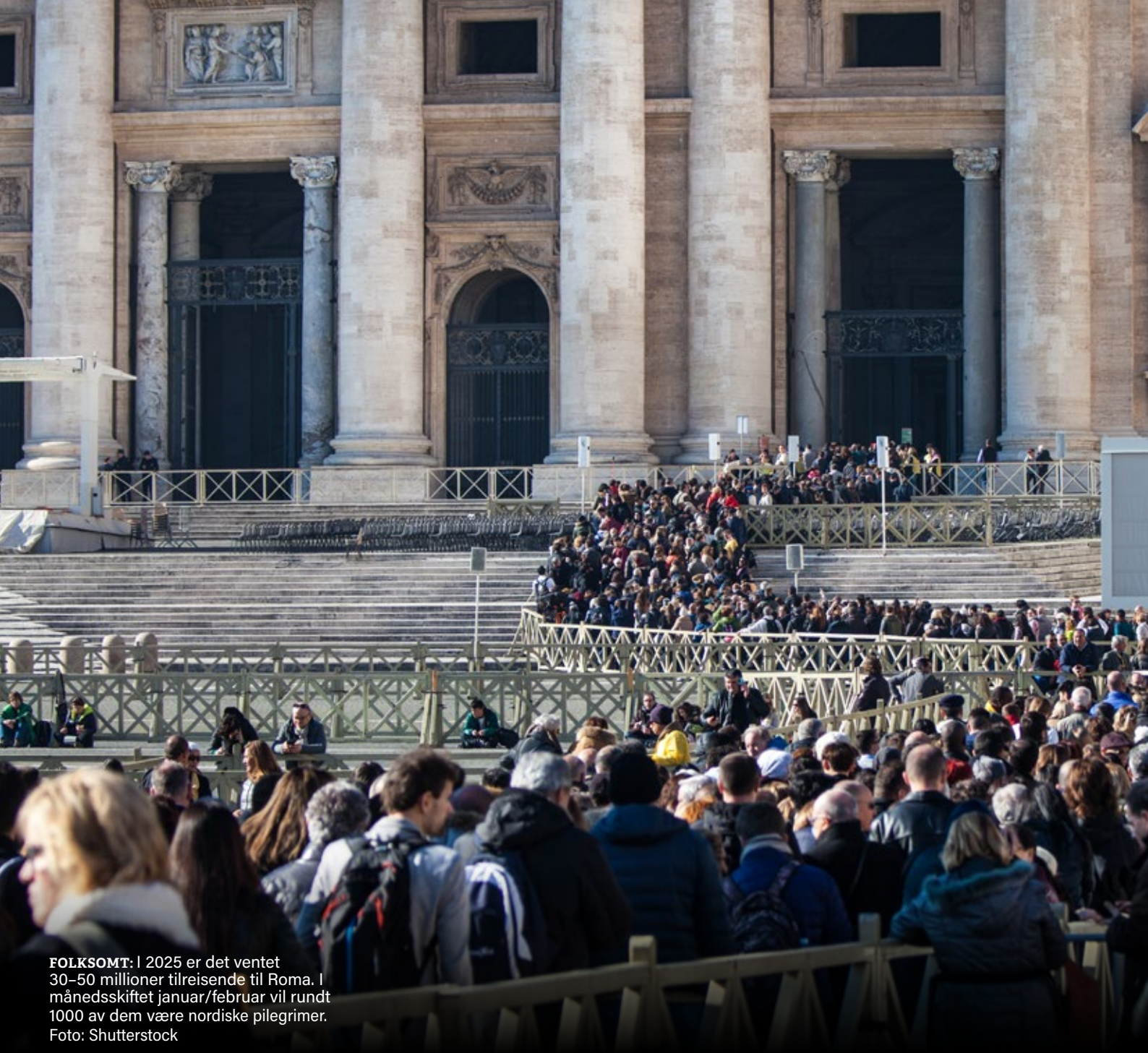
FOLKSOMT: I 2025 er det ventet 30–50 millioner tilreisende til Roma. I månedsskiftet januar/februar vil rundt 1000 av dem være nordiske pilegrimer.